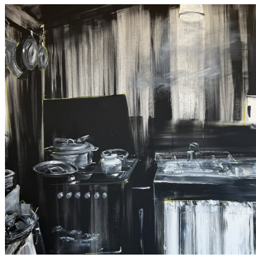
Cuisine mémé mathilde, 150X150