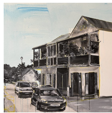
Boutique de l'entre-deux, 150X150