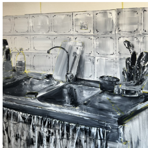
Cuisine mémé mathilde 2, 80X100