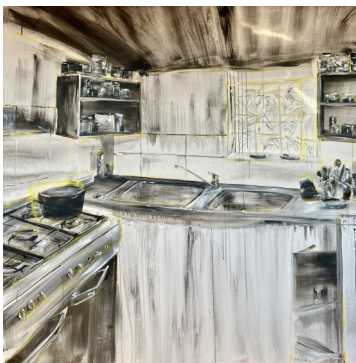
Cuisine inconnu, 210X100