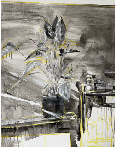
Pot d'fleurs, 80X100