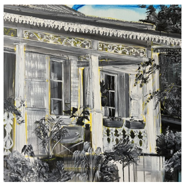
Case créole, 120X120