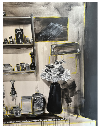
Chez maimiti 2, 80X100