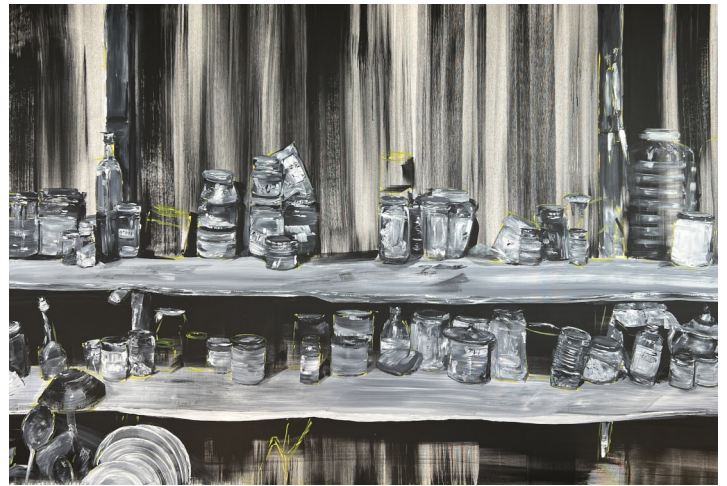
Etagère 3, 150X230