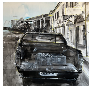
Les hauts, 150X150