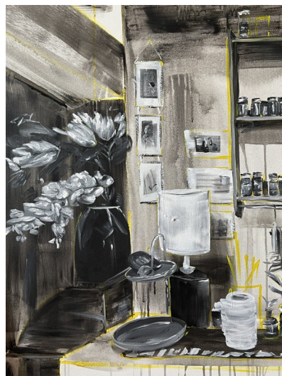
Chez maimiti 1, 80X100