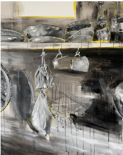
Etagères 2, 80X100