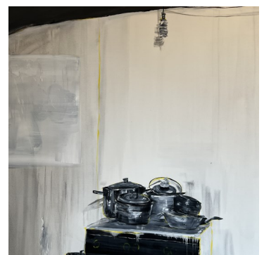
Cuisine mémé mathilde, 150X150