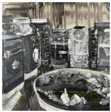
Riz et vanne, 120X120