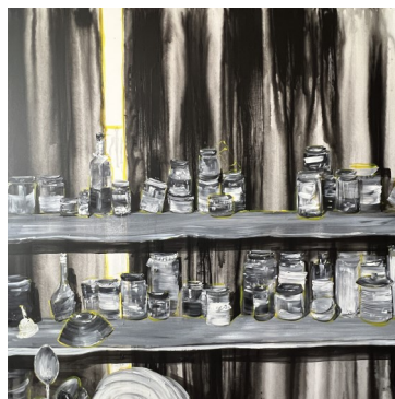
Etagère 4, 120X120