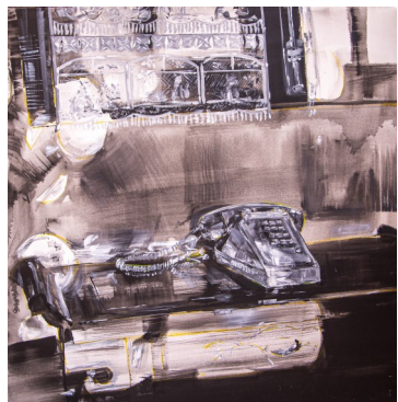
Téléphone mémé, 100X100