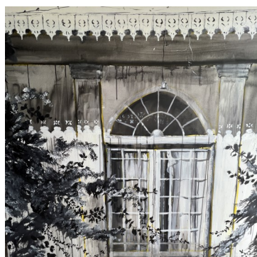
Porte case créole, 150X150