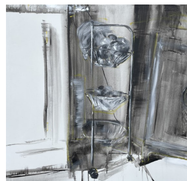
Porte oignon, 100X100